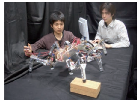
昆虫の運動知能に基づく脚型宇宙ローバの制御(上)と蝶の飛翔原理の解明(下)